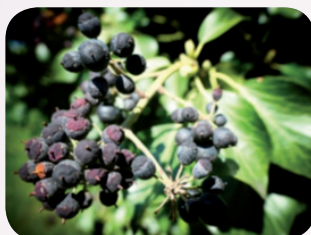
Ne pas croquer