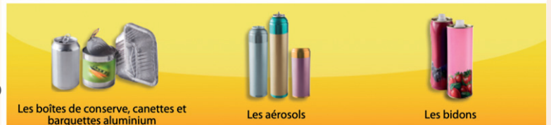
Les boîtes de conserve, canettes et barquettes aluminium