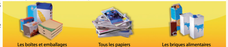
Les boîtes et emballages